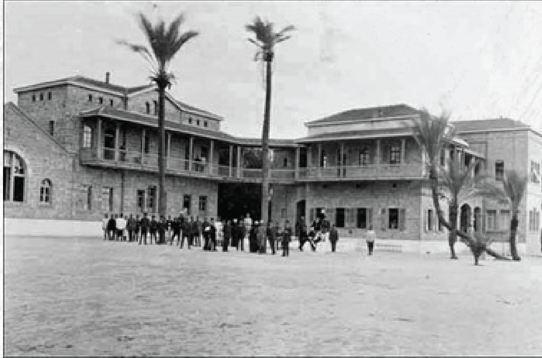
صورة قديمة للمستشفى المعمداني في غزة عام 1916